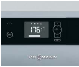
Regelung Ecotronic 100 mit beleuchtetem Display für einfache und intuitive Bedienung

Der Vitoligno 150-S ist ein kompakter, preisattraktiver Scheitholz-Vergaserkessel, der sich sowohl für den monovalenten als auch bivalenten Betrieb (Ergänzung zur Öl- und Gas-Heizungsanlagen) eignet.