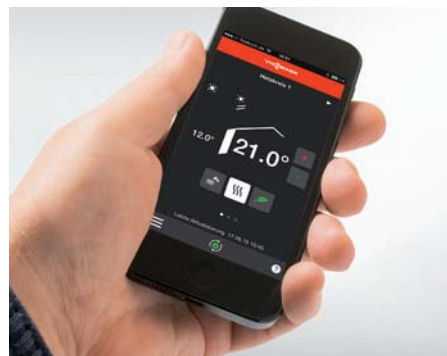
Komfortable Bedienung über Viessmann App per Smartphone aus dem Wohnzimmer

Der kompakte Scheitholzessel ist auch eine hervorragende Wärmeergänzung von bestehenden Öl- oder Gas-Heizungsanlagen. Dann übernimmt er im bivalenten Betrieb die Grundversorgung mit Heizwärme und Warmwasser. Erst bei extrem niedrigen Temperaturen wird der konventionelle Heizkessel zur Abdeckung der benötigten Spitzenlast zugeschaltet.